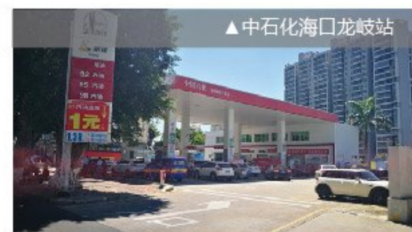
▲中石化海口龙岐站