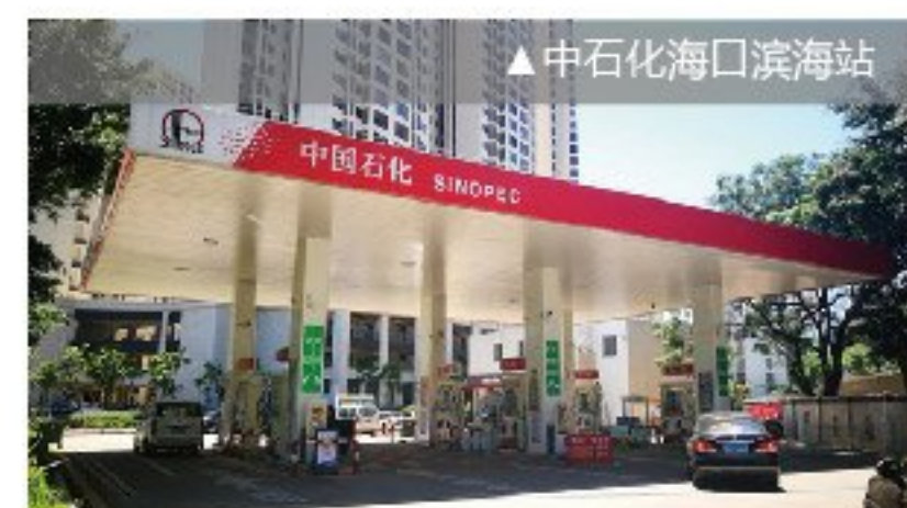
▲中石化海口滨海站