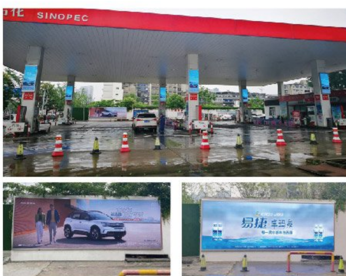
中石化襄阳银溪站

引进设备：LED防爆户外信息发布机（立柱屏）【6台】 LED动态灯箱【1台】 引进系统：多媒体播控系统