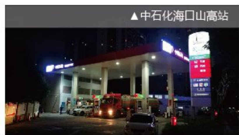
▲中石化海口山高站