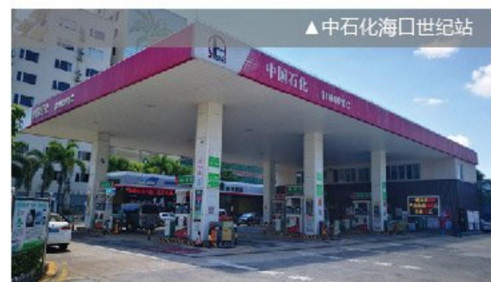
▲中石化海口世纪站

4月中旬，我部门与海康威视达成了合作意向，我部门连同公司设计、装饰版块一起应海康威视总部邀请去往杭州进行考察，重点了解海康威视的新产品及新技术，参观了海康威视智慧安防体验馆，别具一格的设计、匠心打造的细节、智能的终端展现等等让我们考察团感受颇深。海康威视作为全球视频监控的最大供应商、安防界的标杆企业，我司能与其进行产品合作，将有效提升我司在视频处理，图片分析等领域的科技研发能力，尤其是针对石化能源的安全行为判定。