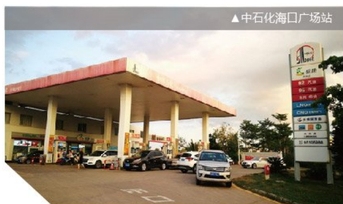
▲中石化海口广场站

6月，恰逢石化海南公司便利店形象设计项目招标，我部门连同公司装饰设计版块一起，前往海口进行业务拓展推广，并计划在海口建设一家以LED动态灯箱为主要产品的样板示范点。